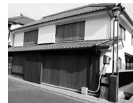
⑱諫山家・桜木家長屋